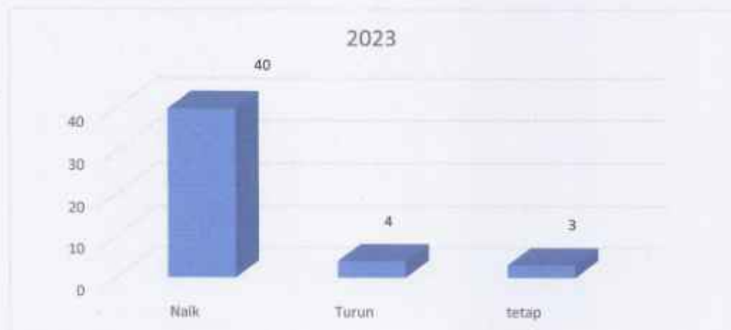
Grafik 3.3 Jumlah OPD Berdasarkan Peningkatan Nilai Hasil Evaluasi di Kabupaten Purwakarta Tahun 2023