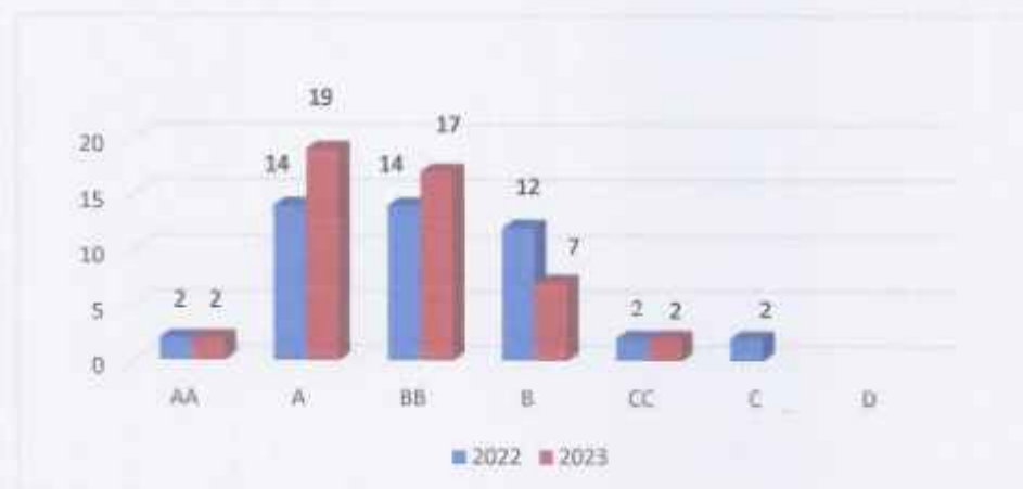
Grafik 3.1 Jumlah OPD Berdasarkan Nilai Hasil Evaluasi SAKIP Di Kabupaten Purwakarta Penilaian Tahun 2023